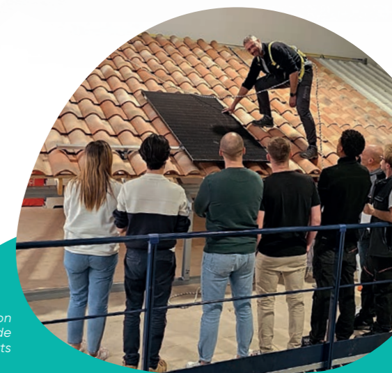
Formation en cours de Solar Experts